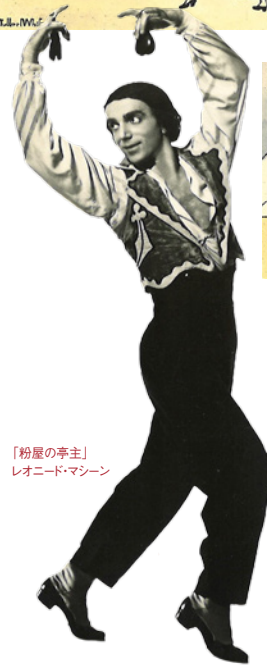
「粉屋の亭主」 レオニード・マシーン