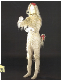
「ブードル犬」の衣装